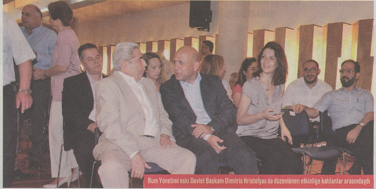
Rum Yönetimi eski Devlet Başkanı Dimitris Hristofyas da düzenlenen etkinliğe katılanlar arasındaydı

Mağusa İnsiyatifi, Kıbrıs Üniversitesi'nin dün akşam düzenlediği etkinlikte, 2015 yılı "Toplumsal ve Kültürel Katkı" ödülüne layık görüldü